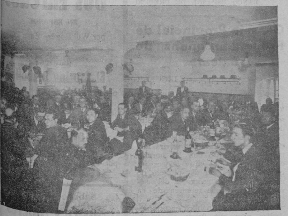
Aspecto que ofrecía el comedor del restaurant Hotel Balear durante la celebración del banquete en honor de los gestores municipales de la C.E.D.A. que renunciaron al cargo

Tarde "Vexilla" (Him) — Eett Tribagio — Zacharías-Bernabé-Sancho "O Salutaris Hostia" — Haller "Pange lingua" — Engel JUEVES SANTO Mañana Misa "Davidica" — Perosi "Christus factus est" (Grad.) — Anerio "Dextera Domini" (Of.) — O. Lassus "Sacerdotes Domini" — Haller