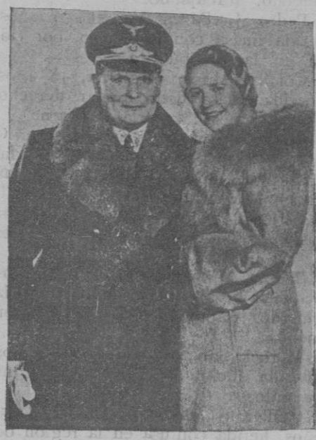
Goering, el lugarteniente de Hitler, ministro del Aire de Alemania y presidente del Consejo de Prusia, con su esposa la famosa actriz Emmi Soune-mann

que había visto. Pero, por desgracia, todo hace suponer que el testimonio de Poncio Pilato que Tertuliano conocía, era un documento apócrifo fabricado por falsarios con buena o dañada intención. Acaso era el primero de la serie de los que se fueron confeccionando con el tiempo. Se sabe que durante la persecución de Diocleciano se fabricaron unas actas presuntas de Pilato, de las cuales dice el historiador Eusebio que estaban llenas de blasfemias contra Cristo y que se había dado orden de distribuir por campos y por ciudades; y los maestros de escuela estaban obligados a hacerlas aprender a los niños que les debían recitar de coro. Este es el más antiguo de los manuales escolares.