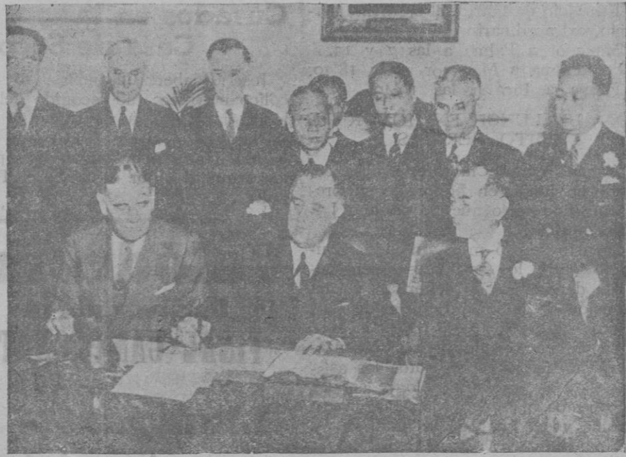
El presidente de los Estados Unidos, mister Franklin Roosevelt, en el momento de firmar, en la Casa Blanca, de Washington, la Constitución de las Islas Filipinas, por la que éstas pasan a ser independientes