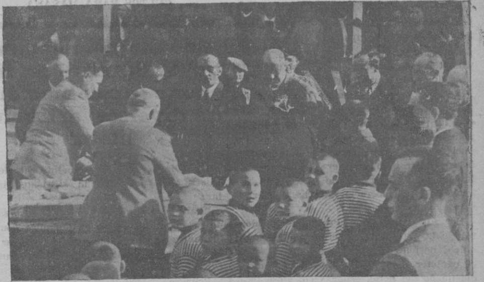
El Gobernador y el Alcalde repartiendo juguetes y golosinas a los asilados.

Glosando la significación del acto que se celebraba, dijo que venía a ser una con-