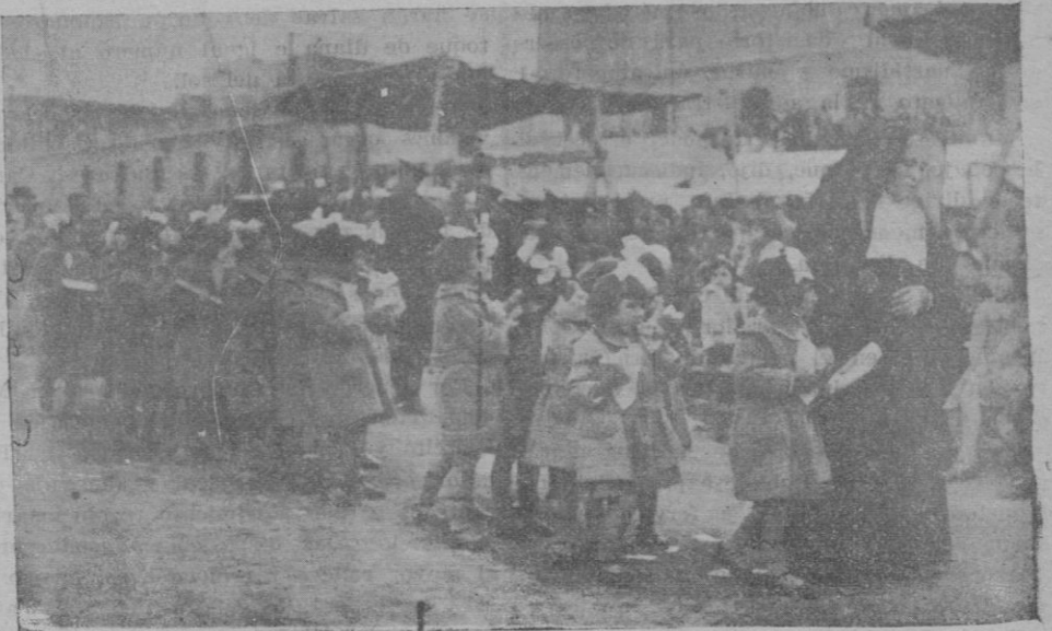
Las asiladas con los juguetes y golosinas con que feuron obsequiadas.