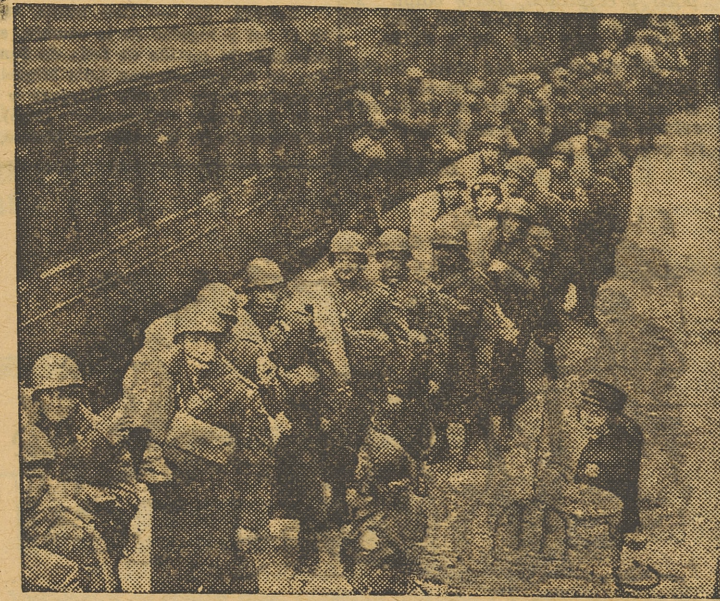
Elementos de la Cruz Roja Americana, preparadas para servir café y buñuelos a los soldados norteamericanos que acaban de llegar a Inglaterra