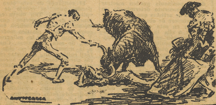
VALENTISIMO QUITE DE «PARRITA» AL «CHONI»

Tercero. — Berrendo. Cumple corriendo en varas, y es bien parecido. Cagancho es aplaudido en varios quites. (Pasa a la página siguiente.)