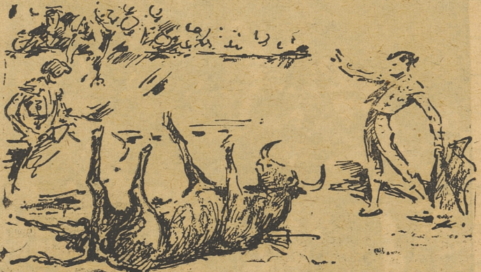
FINAL DE LA NOVILLADA