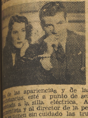
Una de las apariencias y de las circunstancias, esté a punto de ser llamada a la silla eléctrica. Al presentista y al director de la película sin cuidado las truenas.

Norteamericana. — Producción: Paramount. — Distribución: Mercurio Films. — Director: William Clemens. — Intérpretes: Elen Drew, Robert Preston y Nils Asther. — Fecha de estreno: 26 de junio de 1944.