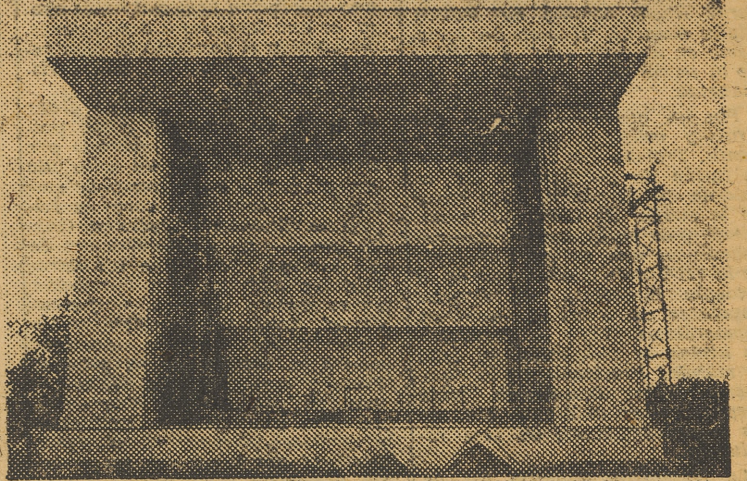
EL TORNAVOZ DE LOS VIVEROS

El aguacer, de última hora de la tarde del sábado impidió una ma-