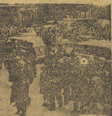
El jefe del Estado francés, mariscal Petain, ha visitado, recientemente, la ciudad de Rouen, gravemente devastada por los aviones angloamericanos.