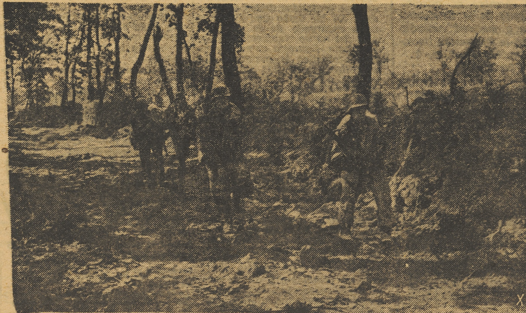
Bajo el fuego de la artillería aliada, grupos de granaderos alemanes se dirigen a sus posiciones de partida, desde donde atacarán a las fuerzas invasoras.