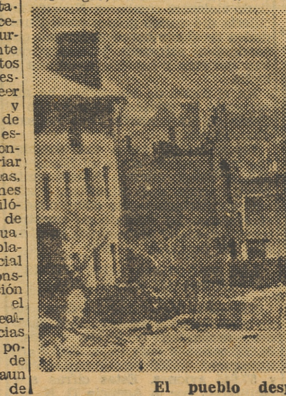
El pueblo después del siniestro

Con el fin de recaudar los fondos necesarios para llevar a cabo la ingente labor que se avecinaba, la Delegación Nacional de Sindicatos, y en su nombre la Obra Sindical del Hogar, ha recurrido a la solidaridad y voluntad de auxilio de todo el pueblo español, ya que en buenos principios es la economía española quien debe soportar la carga de la catástrofe. A tal fin se procedió a la apertura de una pública suscripción en todas las Centrales Nacional-sindicalistas que fué encabezada con una espléndida aportación de la Delegación Nacional de Sindicatos de 50.000 pesetas. El resultado ha superado los cálculos más optimistas; los últimos datos arrojan un saldo que excede del medio millón de pesetas, y esperamos ver aumentar esta cifra considerablemente.