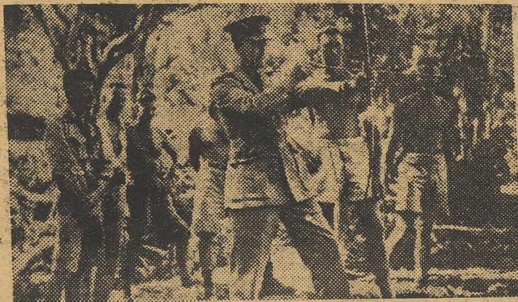
Sir Cyril Newall, gobernador general de Nueva Zelanda, visita a los soldados neozelandeses convalecientes en Nueva Caledonia, y se adiestra, con ellos, en la práctica de lanzamiento de flechas. — (Foto Cifra).

En Crimea han sido rechazados los ataques soviéticos, así como en el Bug inferior, que no han conseguido cruzar los golcheviques. En el Dniester se libran combates de suerte alterna y se han destruido 34 carros blindados de los soviets.