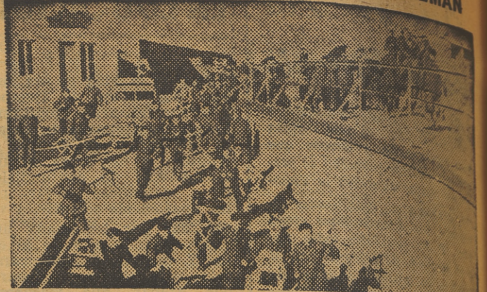
Un antiguo fortín francés sirve de alojamiento a los miembros del Servicio Alemán de Trabajo, en una región del Oeste de Francia. La fotografía muestra el momento de instalarse en él.