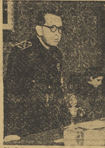
El jefe provincial haciendo uso de la palabra en el acto de la