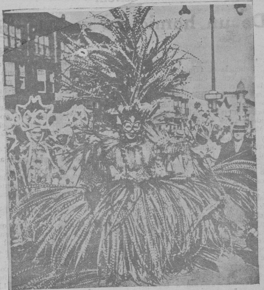
El carnaval en California. — He aquí a un caballero tan exóticamente disfrazado, que se confundiría fácilmente con un paisaje de Hawaii