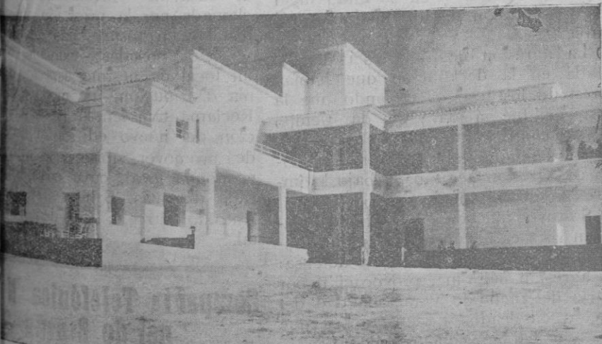
Escuela de Montuiri, que se inauguró el domingo

...niable iniciativa de dar nueva... a las fiestas de Carnaval, organizado por la Asociación de Delineantes y Dibujantes de Mallorca que ha servido de estímulo a nuestra actividad para ejercitarse en esta modalidad artística que tanto se presta al vida de un expresionismo que brinda tan optimista. ... muchos años, el Círculo de Bellas Artes de Madrid viene celebrando sendos concursos en este sentido, siendo unánime el sentir crítico en apreciar que cada vez mejores carteles pregonándose las características entre expertos jurados del lápiz, teniendo la virtud de descubrir anualmente que luego han quedado incorporados por su destreza y solvencia artística grupo de ilustradores de las más altas revistas gráficas y arte de la que cuentan con firmas tan prestigiosas como las de Ribás, Penagos, Del Bartolozzi, Pedraza, Alonso, Echea, Muñoz, Baldrich, Lambarri y otros de valía que forman la vanguardia de dibujantes españoles. ... concurso celebrado en Palma ha sido insuspechado por el número y calidad de autores que han demostrado conocimiento del cartel, descubriendo valores que se habían manifestado públicamente en algunos con verdadera origi-