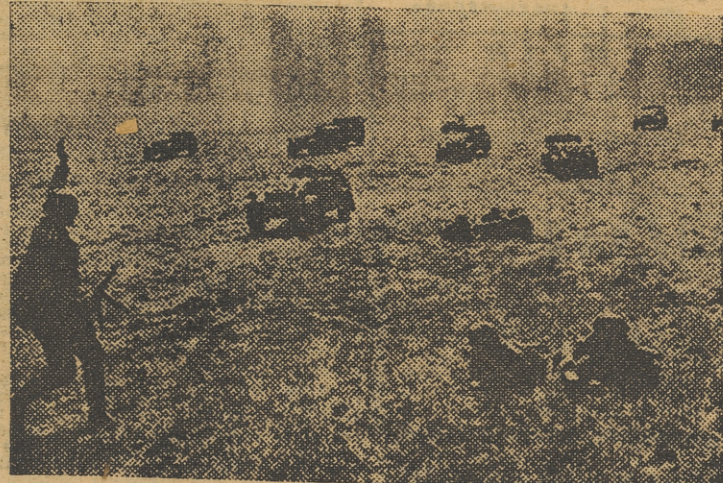
Transportados en automóviles, los soldados alemanes avanzan a través de la llanura rusa.