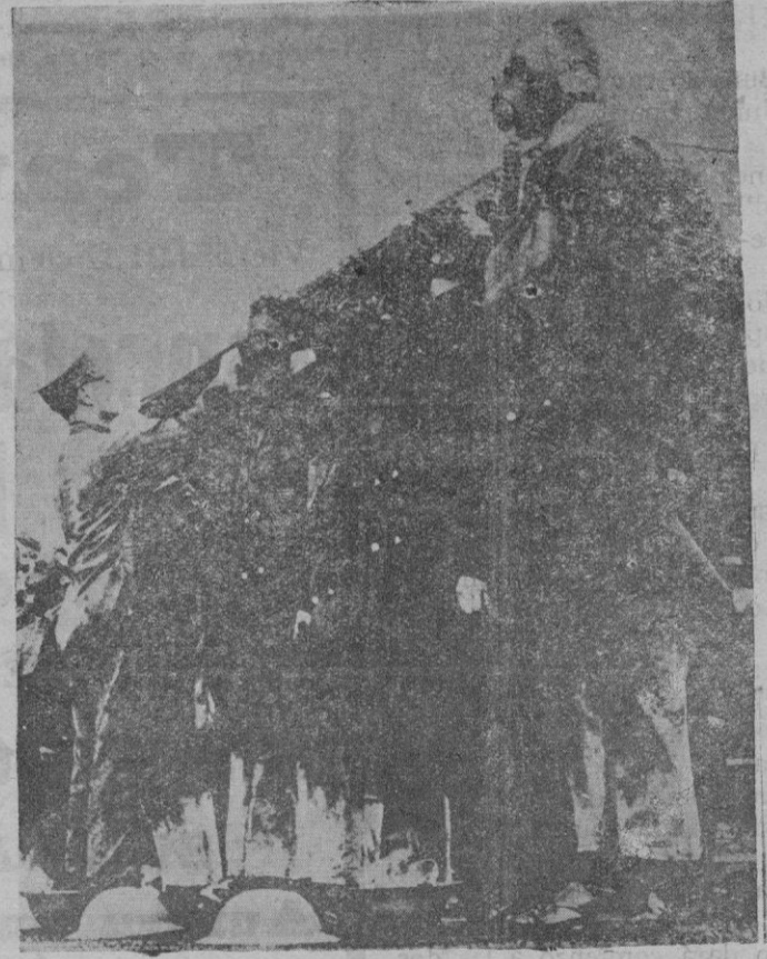
Las tropas inglesas que forman parte del Ejército interna- cional que ha ido al territorio del Sarre, han sido provis- tas de máscaras contra los gases