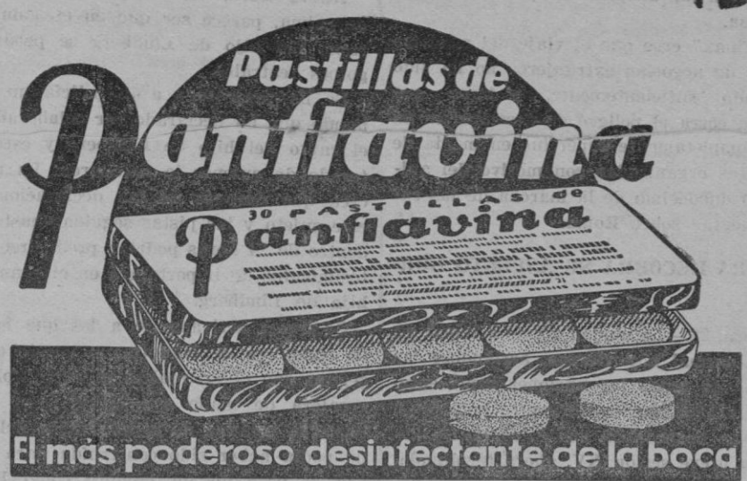
El más poderoso desinfectante de la boca

El mismo periódico añade que los centros políticos están firmemente convencidos de que las proposiciones del gobierno para reformas constitucionales obtendrán una mayoría considerable de votos, en el Senado y en la Cámara de diputados.