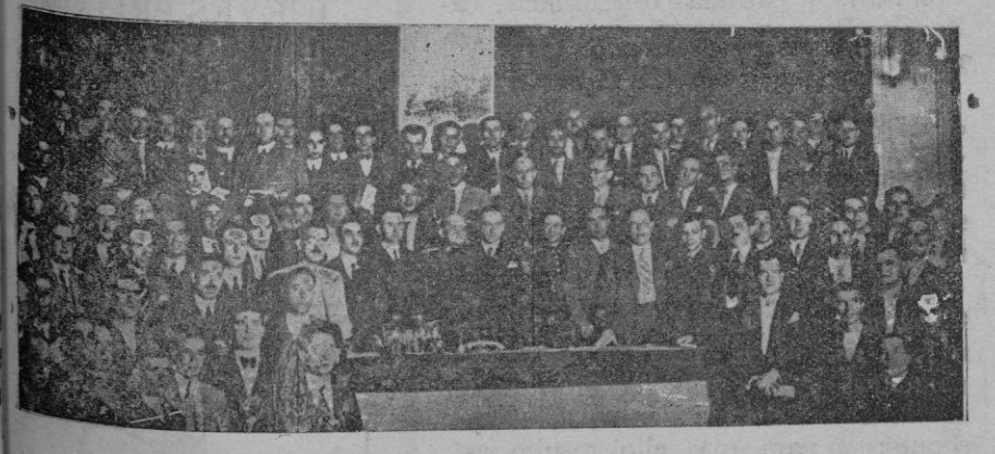
Salón de fiestas del Metropolitano, en Madrid, donde se ha celebrado la inauguración de la Asamblea nacional de guardias municipales