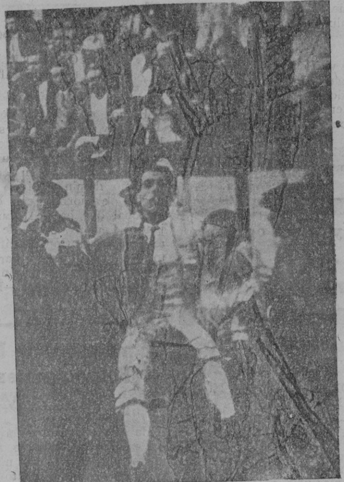
El Idiestro Atarfeño al ser conducido a la enfermería donde falleció

kilos; 37 lechons, 1.228. Totales: 55 cabezas, 2.437 kilos.