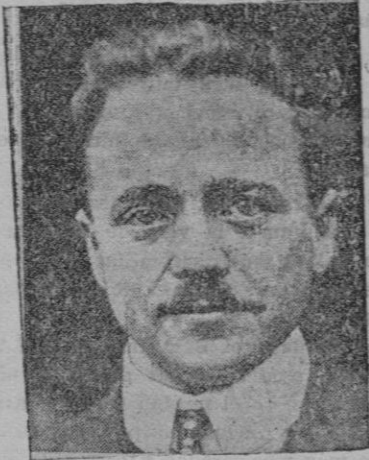
El canceller Dollfus que ha sido asesinado en la propia cancillería por un grupo de "nazis"

tiene fama de ser diurética, disolvente de los cálculos renales y la mejor de la isla. No tengo ánimo de restarle la menor importancia, pero debo hacer constar que las otras dos citadas, de Escorca y la "font Sorda", no son inferiores en bondad a la del Pedregar. Ha, ya más de cuarenta años, que mandé a Madrid, al Instituto de Alfonso XII, seis botellas de agua, dos de cada uno de los citados manantiales, para su análisis, y se me contestó que eran exactamente iguales las tres, que no contenían sustancia mineral alguna ni vestigios de materia orgánica y que eran eminentemente potables. Creen muchos que las mentadas aguas son diuréticas, y en parte tienen razón, aunque no contengan sustancia alguna química que estimule la diuresis, y lo que ocurre es que el que prueba dichas aguas, las bebe aún sin sed en gran cantidad, por la fama de que vienen precedidas, y, de una manera mecánica, producen el efecto diurético, con lo que se consigue una especie de barrido del aparato urinario. De modo que, por lo expuesto, se infiere que son muy convenientes al litiasis las mentadas aguas, que puede beberlas indefinidamente, ya que no ingiere con ellas droga alguna, ni con su ausencia de sustancia mineral pueden producir cálculos.