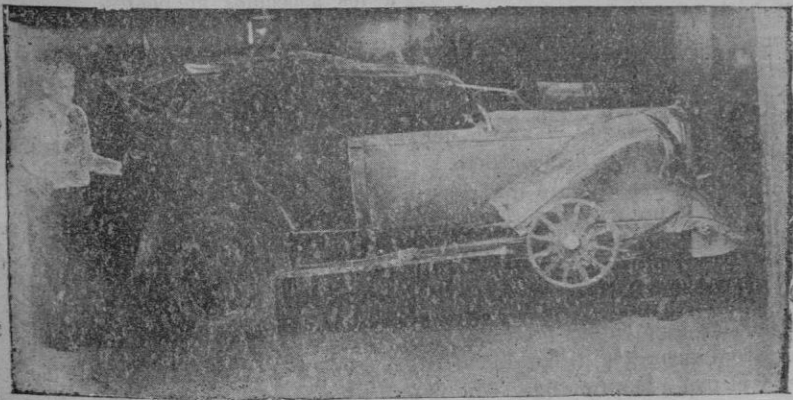
Estado en que quedó el coche que dió la vuelta de campana en la carretera de Inca, de resultas de la cual hubo cuatro heridos.