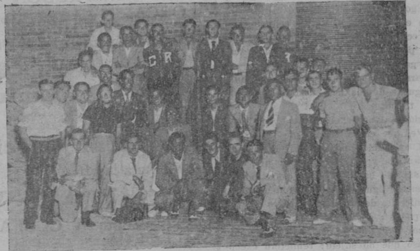
Grupo de nadadores y directivos que anteanoche salieron para Barcelona para tomar parte en el campeonato.

ma y gozar de las bellezas que atesoran aquellas montañas. Por lo que, se somete a la consideración de los propietarios de Aubarca y Son Amer, cuyas fincas se aproximan mucho al Monasterio en sus linderos el emplazamiento de un Hotel, que, además de llenar el fin indicado, podría rendir pingües ganancias.