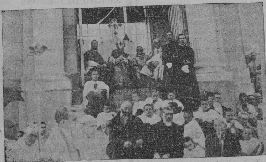
El Excmo. Arzobispo-Obispo de Mallorca en la bendición del monumento al Sagrado Corazón de Jesús en San Salvador, de Felanitx