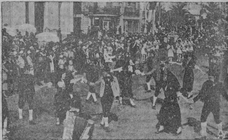
En Niza se han celebrado grandes fiestas populares, en las que han tomado parte representantes de todas las provincias francesas. En la fotografía aparece en primer término un grupo de alsacianos ataviados con sus típicos trajes, ejecutando una danza popular de su país, en pleno paseo de los Ingleses. Cunde, pues, el culto a lo típico, como se intenta en Mallorca.

La política social de las derechas españolas, revolucionaria en cierto modo, como respuesta a corregir injusticias evidentes está basada en la concordia. Para ello es esencial una reforma en las conciencias, a fin de que no contemplan impasibles la existencia de enormes fortunas y de miserias desesperantes. Labor de apostolado a la que debe seguir la acción política, reconociendo al Estado el derecho de intervenir en las luchas sociales sobre la base de que