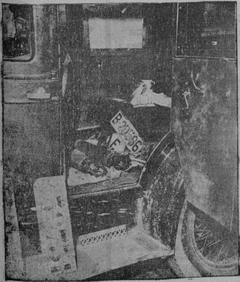
Interior del "automóvil fantasma", en el que puedan verse dos bombas de grandes dimensiones y numerosos números de matrícula para sustituir al que llevaba el coche en el momento de actuar los atracadores

LA ALMUDAINA de hoy consta de doce páginas