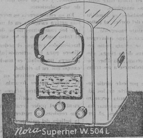
Nora-Superhet W.504 L