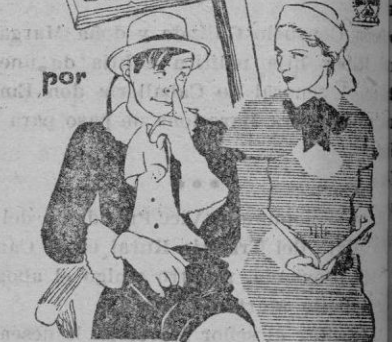
FERNAND GRAVEY Y FLORELLE