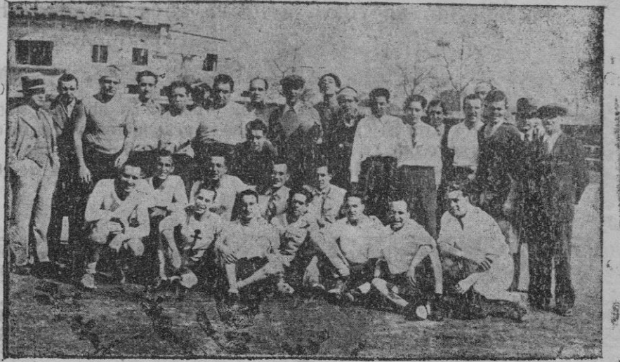
Grupo de jugadores antiguos que pertenecieron a los equipos Alfonso XIII y Veloz que el domingo pasado jugaron una típica costellada

Han sido impuestas varias multas por la circulación de coches en las explanadas de la muralla y el Alcalde ha reiterado a los agentes de esa autoridad las órdenes de que extremen su vigilancia y celo para evitar,