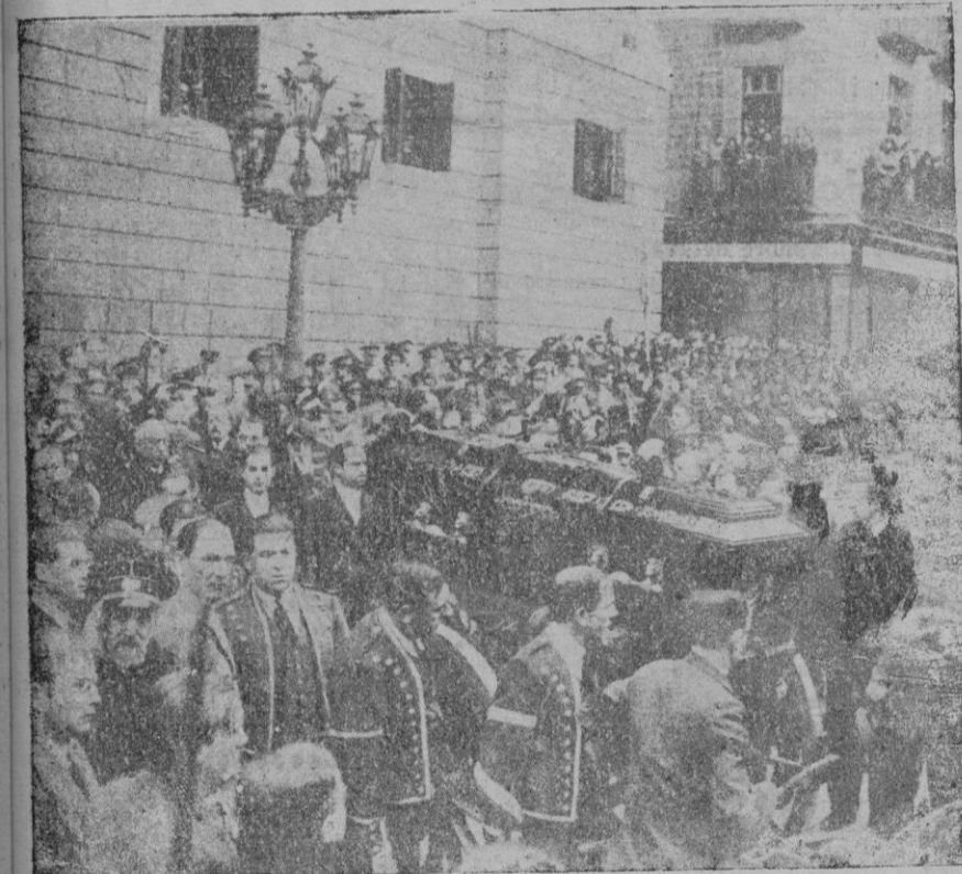
El entierro del Presidente de la Generalidad, en la Plaza de la República