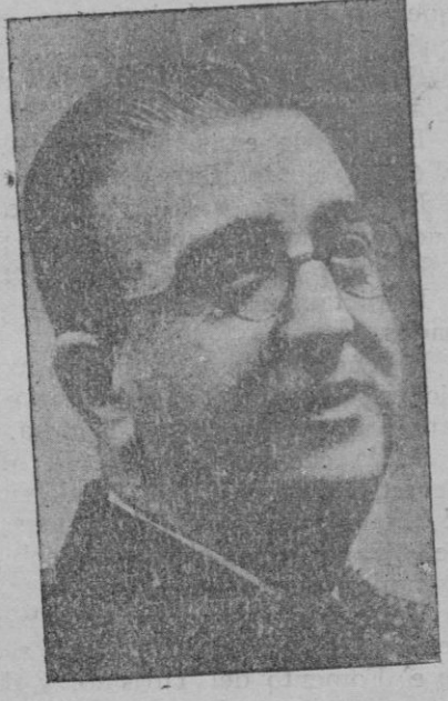
Sr. Pareja Yébenes, nuevo ministro de Instrucción Pública