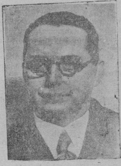
El señor Estadella, nuevo ministro del Trabajo