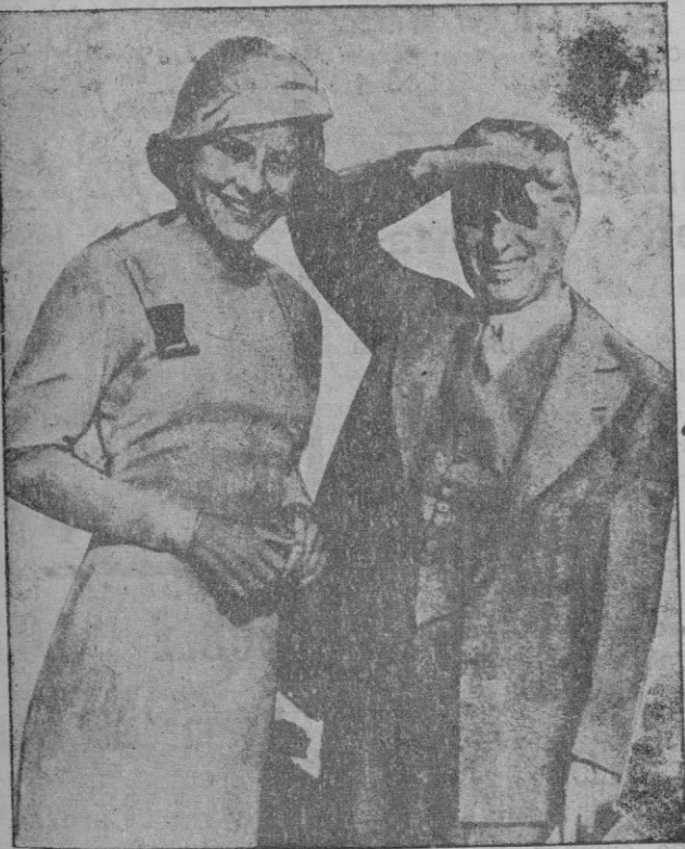
La vedette francesa Paulette Goddard, con la que se ha casado secretamente Chaplin

noCIÓN más alta y patriótica de la emisión del voto? Hay que dar al país la plena sensación de que la autoridad está dispuesta a impedir cualquier desmán. En honor a los actuales gobernantes debemos reconocer su conducta plausible que contrasta con actos de los anteriores. Antes, si las derechas preparaban un mitin, una asamblea, se salían los de la Casa del Pueblo con pretensiones de impedirlo, y como anunciaban la huelga general, el Gobierno para evitar un día de luto, decía, suspendía el acto de las derechas, así los izquierdistas se salían con la suya, y el poder quedaba a sus pies y malparada la libertad. Ahora no ha pasado así: los socialistas de Toledo, para impedir la Asamblea de las Juventudes Católicas, amenazaron y declararon la huelga general, pero el Gobierno amparó a las Juventudes Católicas y la Asamblea se celebró y también se declaró la huelga, pero ésta de nada sirvió para los fines que pretendían sus organizadores, gracias a que ha habido una autoridad que ha garantizado la libertad, y lo mismo pasó en Calahorra donde se quería impedir que Gil Robles diese una conferencia. En honor a la verdad hay que poner de relieve esos casos que dan forzosamente un margen de confianza a los actuales gobernantes que, de seguir así, podrán sacar limpias sus vestiduras para bien de España y buen nombre de la República.