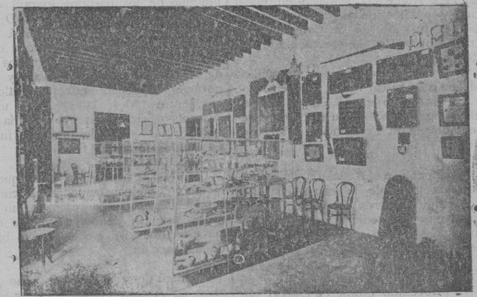
Dos aspectos del interesante Museo de Artá.