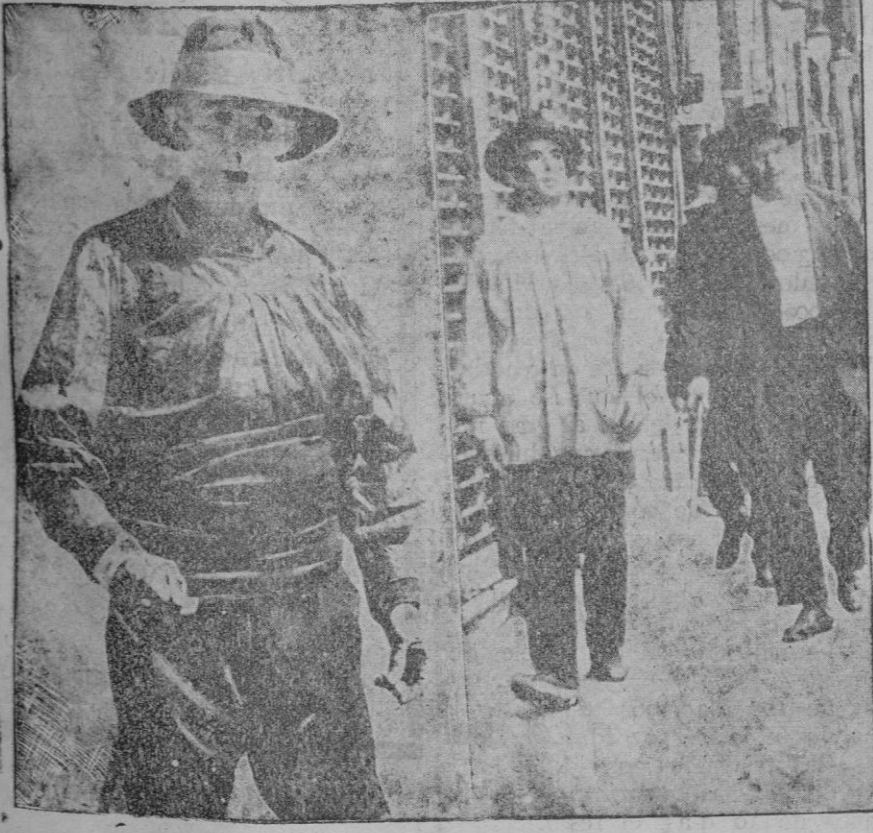
Tipos de agrarios que el domingo desfilaron por Madrid. Fueron los que no advertidos a tiempo de que se suspendía la marcha a Madrid, realizaron el viaje