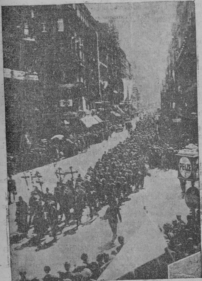
El Congreso Católico de Viena.—Desfile por las calles de Viena de una columna de peregrinos