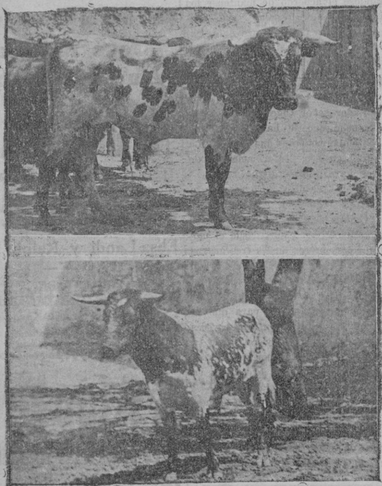
Do sde los novillos que han de lidiarse mañana e nuestra Plaza de Toros en la corrida a beneficio del Montepío de la Alianza profesional de Camareros de Palma