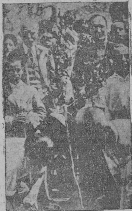
El presidente de la Generalidad, en un momento de la Fiesta del Arbol Frutal celebrada en memoria de Francisco Vinas, que la instituyó

Su "querido", es decir, su marido Gedeón, hacía todas estas preguntas a Odette antes de acompañarla a la estación, pues su mujer salía en el expreso de Trouville, invitada a pasar tres días en casa de unas amigas.