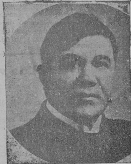
El gran tenor don Francisco Viñas

El tenor Viñas siguió su carrera triunfal