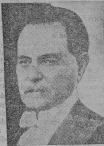
El ex-presidente de la Argentina D. Hipólito Frigoyen recientemente fallecido

hacerse esos movimientos, que en cierto modo me parecen esenciales; pero eso cuando se dan ciertas circunstancias que los hacen viables.