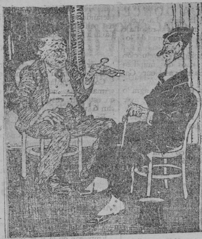
—He decidido que mi hija aprenda el canto en el Extranjero. El vecino.—¿Y me lo dice usted ahora, cuando ya he encontrado cuarto? (De "Musketo", de Viena)