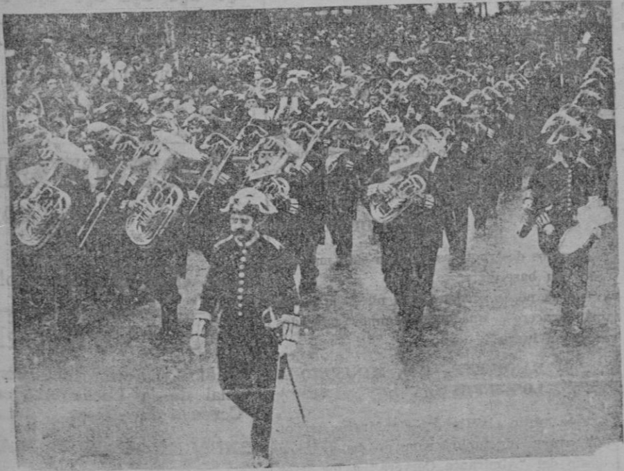
La Banda Republicana española en París, e nel gran desfile celebrado en la avenida de los Campos Eliseos

El papel de la burguesía, si es preciso, que lo realicen ellos, con su responsabilidad y con nuestra presión para que lo hagan lo mejor posible, con objeto de servir el día de