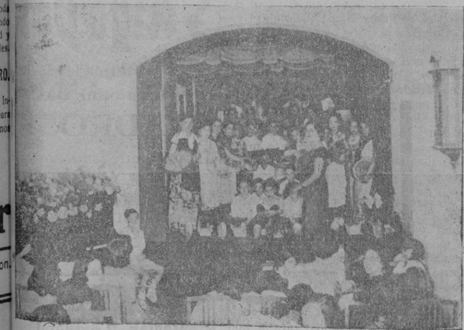
El Colegio de las señoritas Mateu.—Los alumnos que tomaron parte en la velada literario-musical.

A más de sesenta ascienden los paisajes y marinas expuestos. De pequeñas dimensiones casi todos, tratados de manera francamente impresionista, enérgicos de toque, frescos y luminosos de visión, esos cuadros, o mejor, apuntes, muestran uno de los aspectos más interesantes de la personalidad de Gonzalo Bilbao. Recogen calles de Toledo y Sevilla, costas del Cantábrico, rincónes de Navarra, motivos de Fuenterrabía y Ondárroa, paisajes del pueblo francés de Cha-