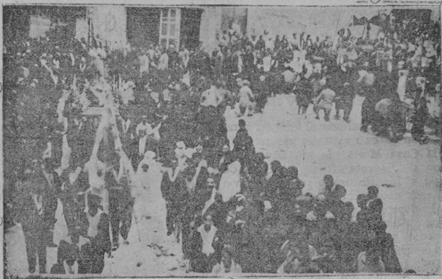
La procesión del Corpus celebrada este año con inusitado esplendor en Sineu.

Se repartirán también en taquilla desde una hora antes de empezar el acto.