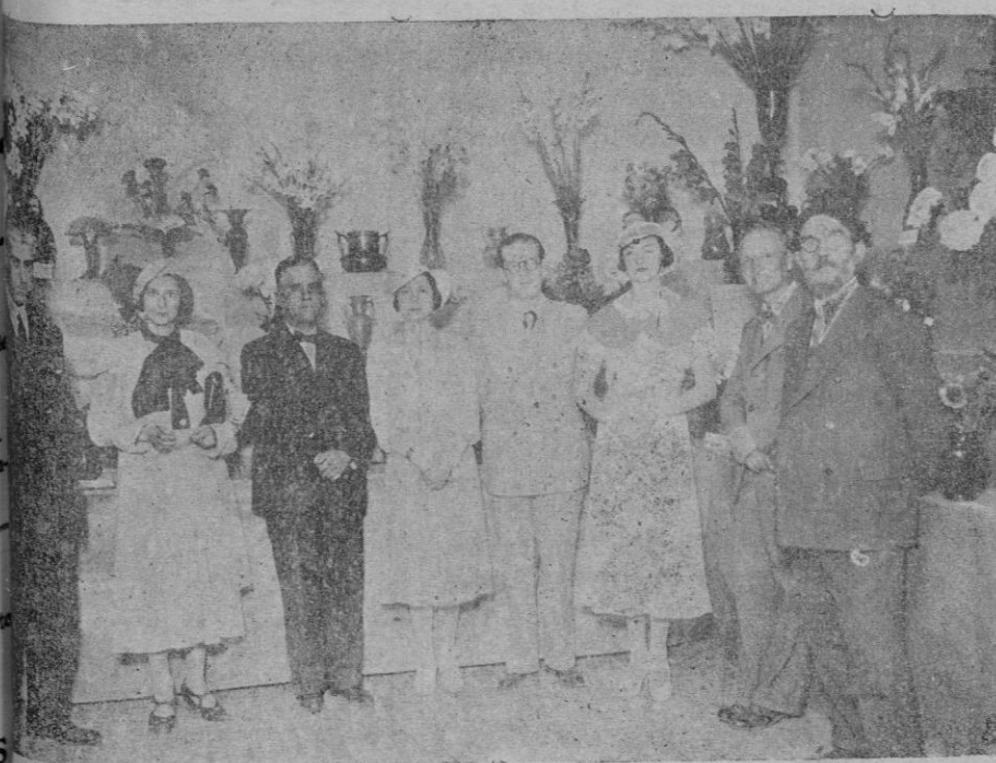
Foto de la III Exposición de Flores y Plantas organizada por "L'Associació per la Cultura de Mallorca".