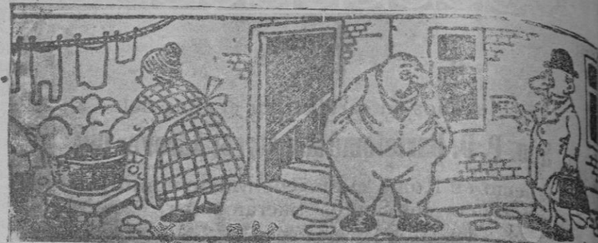
—Vengo a ofrecerle a usted una buena máquina para lavar. —Gracias, tengo una excelente.