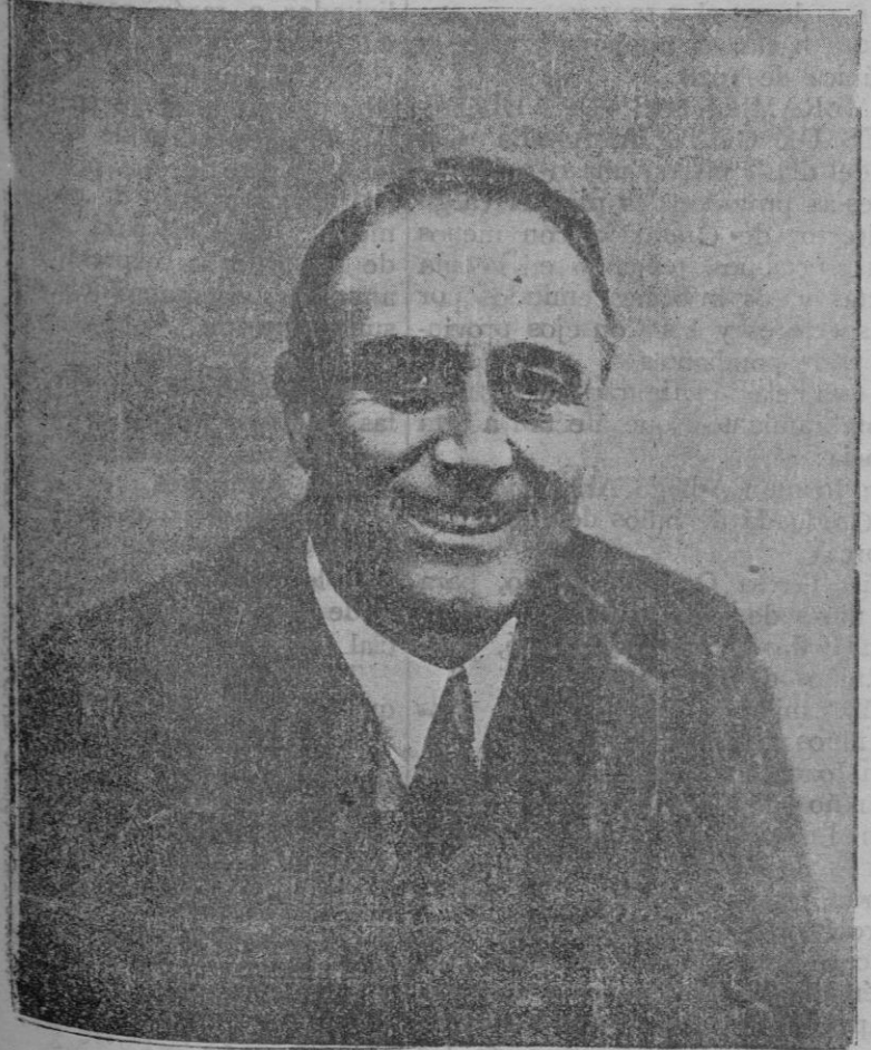
Franklin D. Roosevelt, que el sábado tomó posesión de la Presidencia de los Estados Unidos