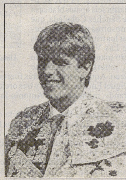
"El Cordobés" sigue arriba.