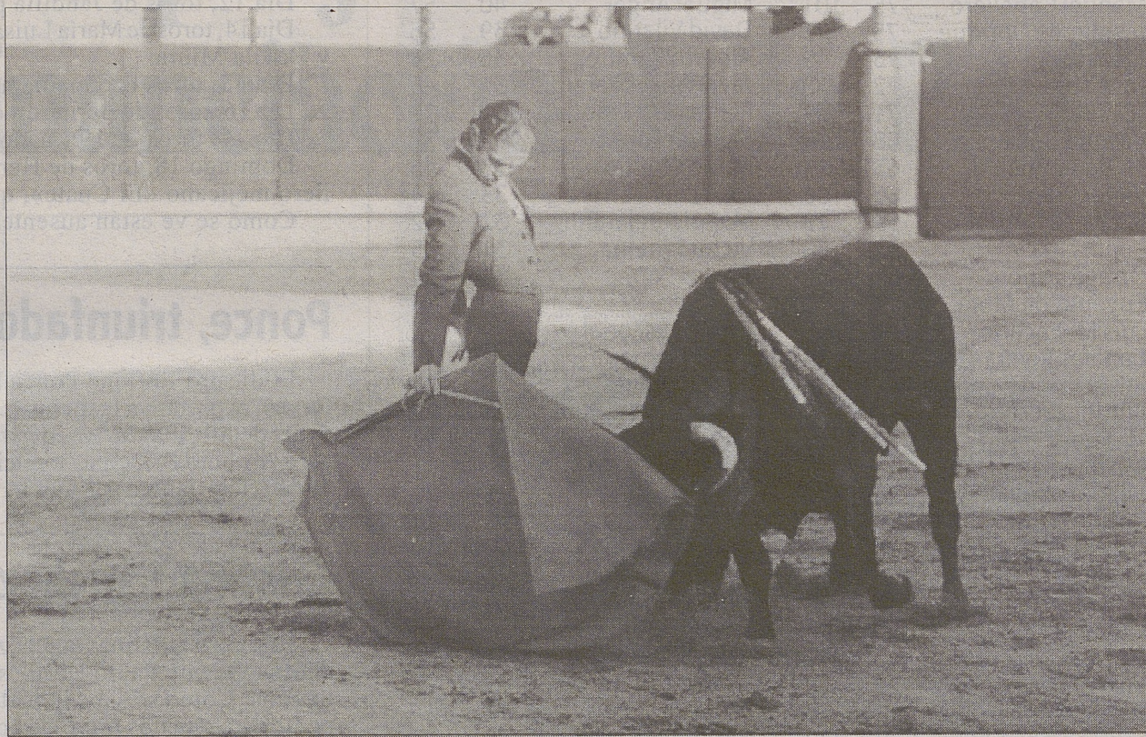
Un momento de la pasada edición del Festival de la Asociación Amigos del Toro.

En cuanto a festejos mayores, puntualizar que han sido ocho las corridas de toros que se han celebrado en la provincia y en los siguientes municipios: En Guadalajara se han celebrado cuatro corridas de toros, y una