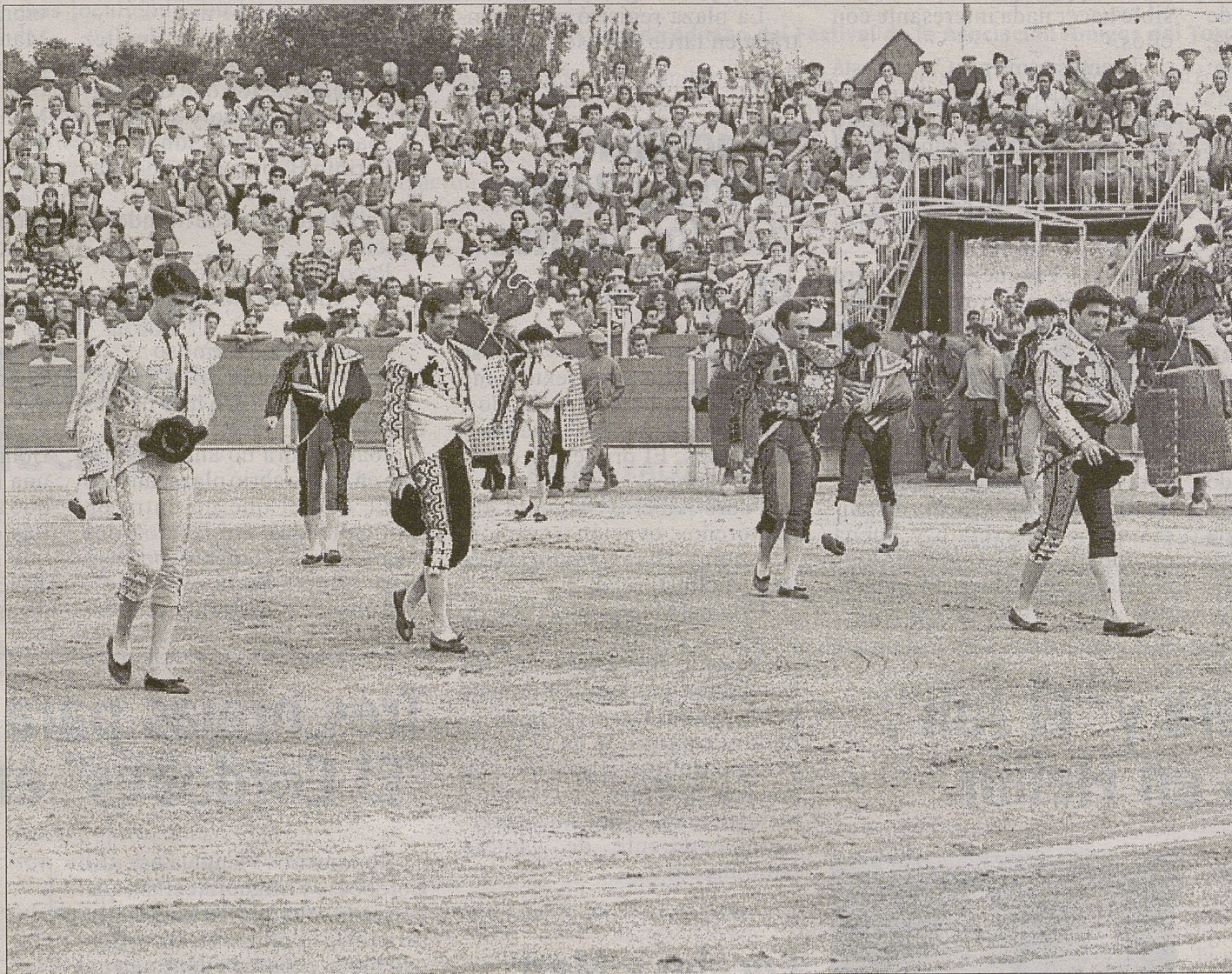
Almodóvar del Campo organizó la Feria taurina con mayor número de festejos de la provincia.