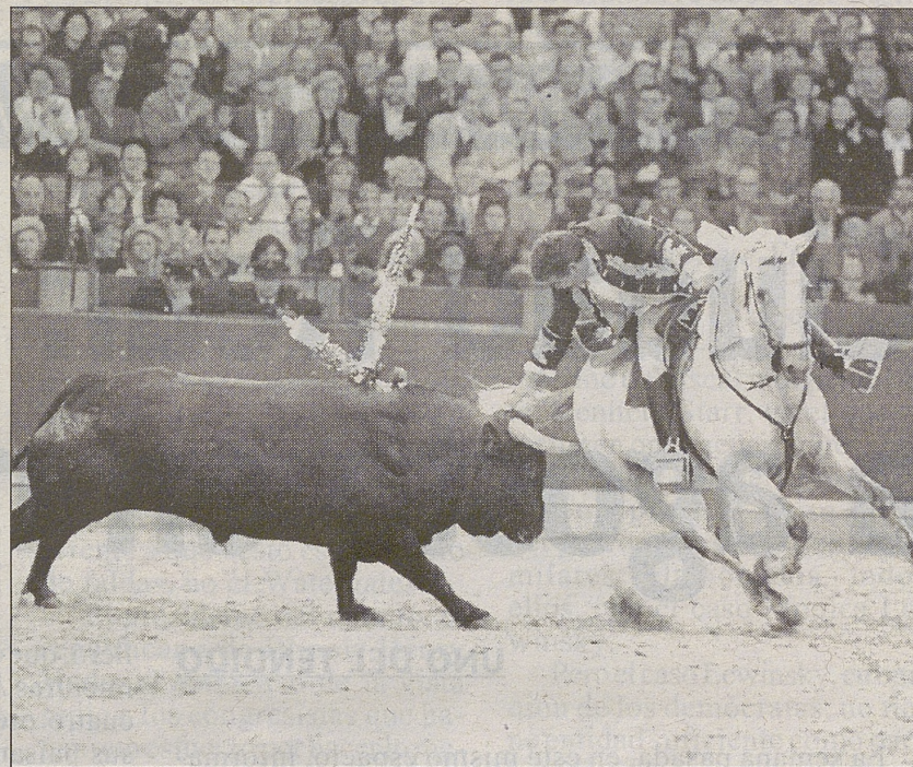
Bohórquez realizó una gran faena.