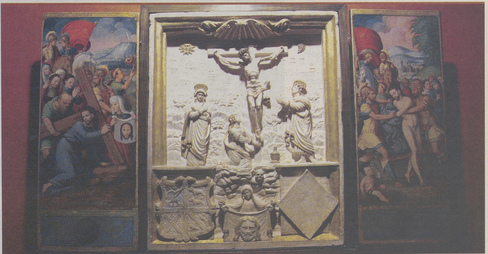
Tríptico con calvario de alabastro y puertas pintadas al óleo, del siglo XVI, procedentes de Villanueva de San Mancio (Valladolid). / RAÚL SANCHIDRIÁN

personas visitaron 'Testigos' durante las treinta primeras semanas