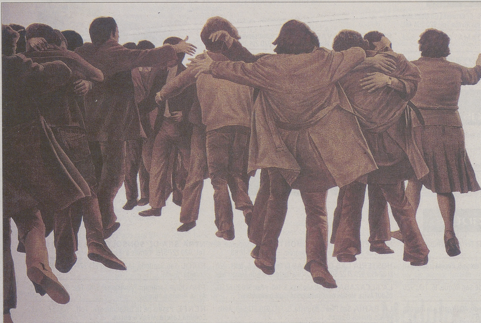
'El abrazo', de Juan Genovés, es una obra acrílica sobre lienzo de 1976.