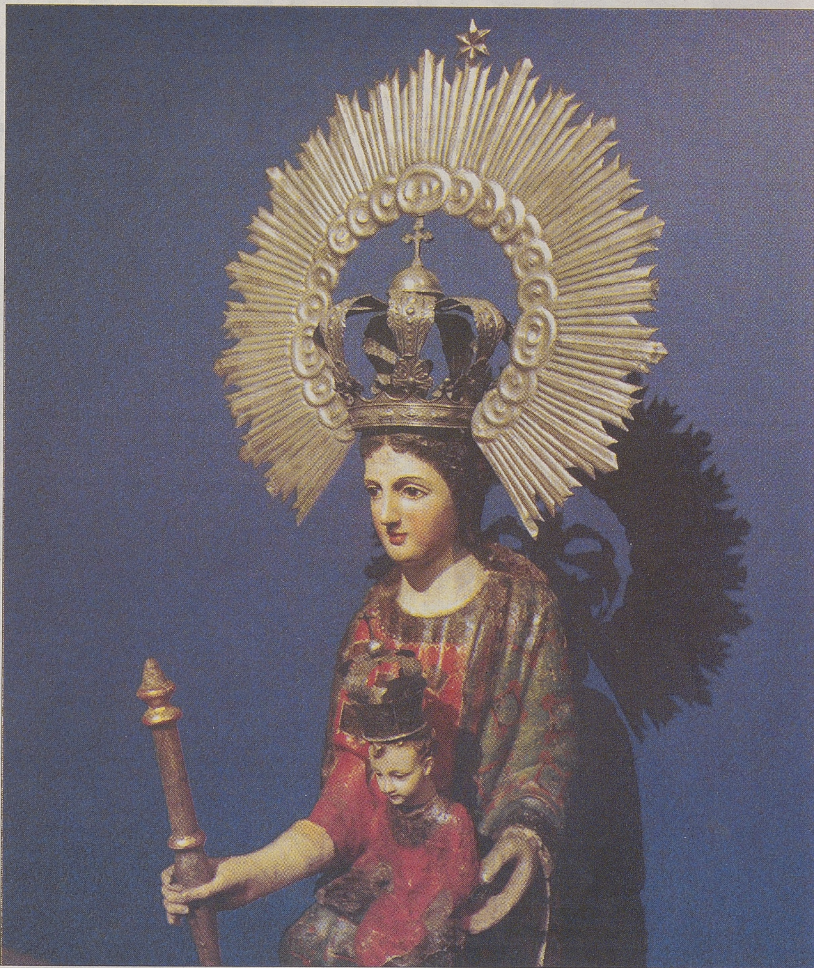
Imagen de la Virgen del Prado, procedente de la iglesia de San Nicolás de Bari de Valladolid.

La generosa aportación a 'Testigos' se completa con las obras cedidas por 16 museos de Castilla y León, Andalucía, Extremadura y Madrid, siete archivos y cuatro bibliotecas, incluida la Biblioteca Nacional de Madrid, tres diputaciones provinciales (Ávila, Palencia y Valladolid), dos ayuntamientos (Ávila y Tordesillas), dos obispos (León y Palencia), un palacio arzobispal (Valladolid), dos Consejerías de Cultura (Andalucía y Castilla y León), el Patrimonio Nacional, la Dirección General de Bellas Artes y Bienes Culturales de Madrid, la Fundación Lázaro Galdiano y seis colecciones privadas, a gunas de ellas de Ávila.