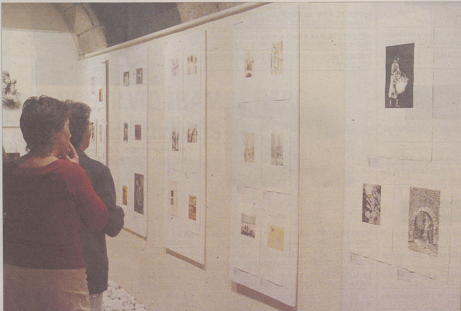
Dos personas visitan la exposición, que fue inaugurada ayer.