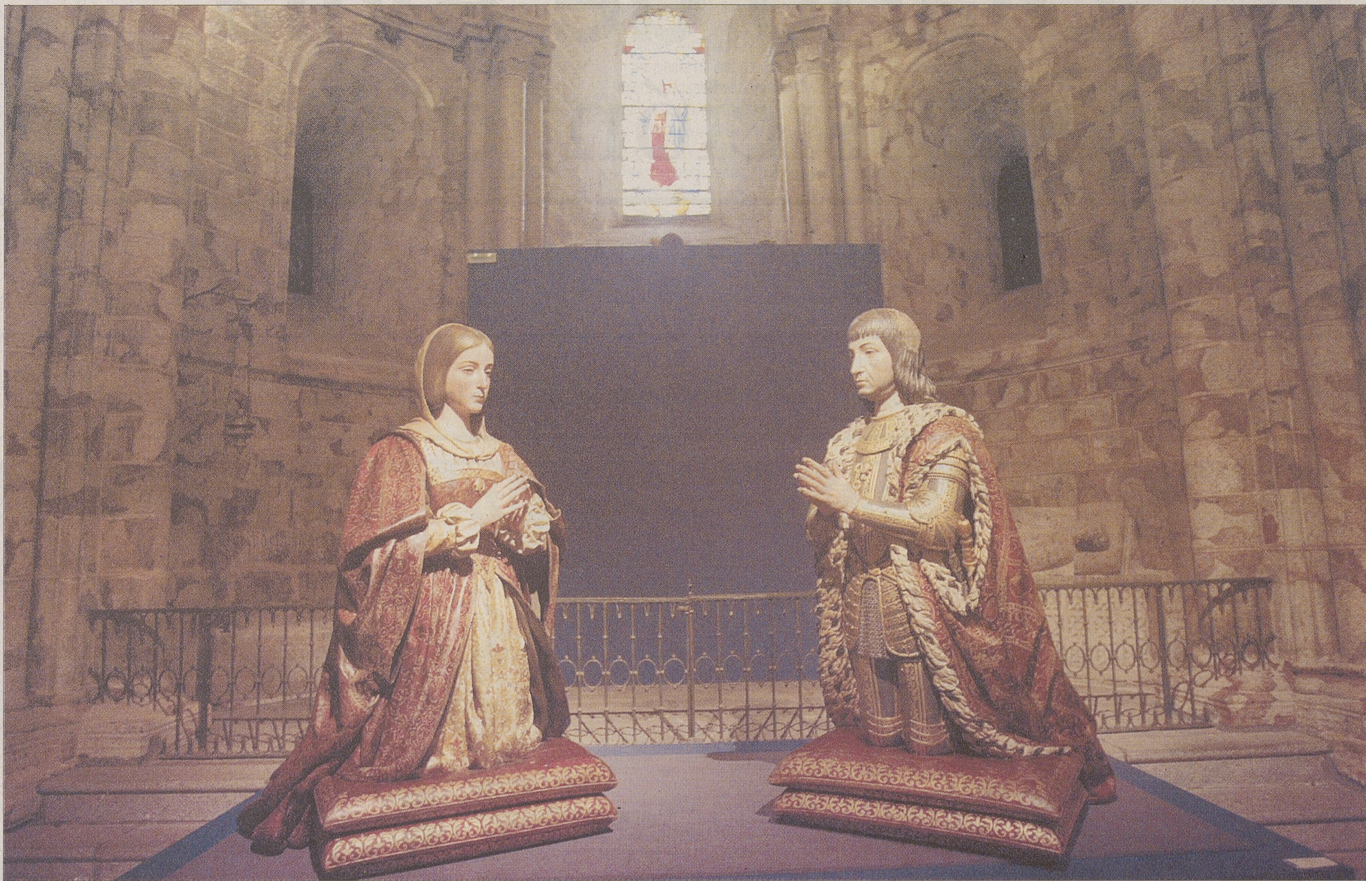
Las estatuas orantes de los Reyes Católicos son obra de Pedro de Mena para la Catedral de Granada.