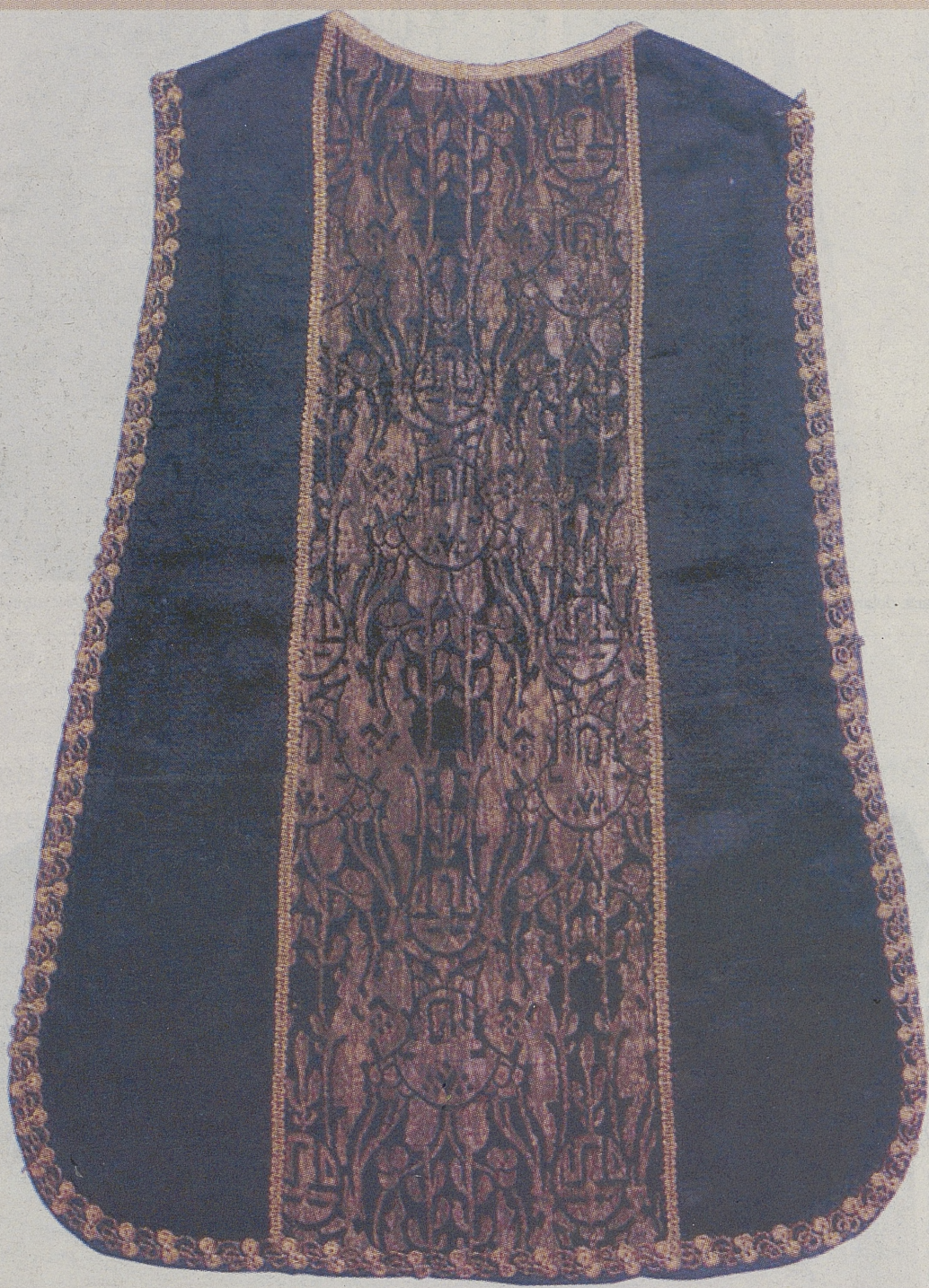
Anverso de la casulla negra procedente de la iglesia parroquial de Pedro Rodríguez.

personas visitaron 'Testigos' durante las dieciocho primeras semanas