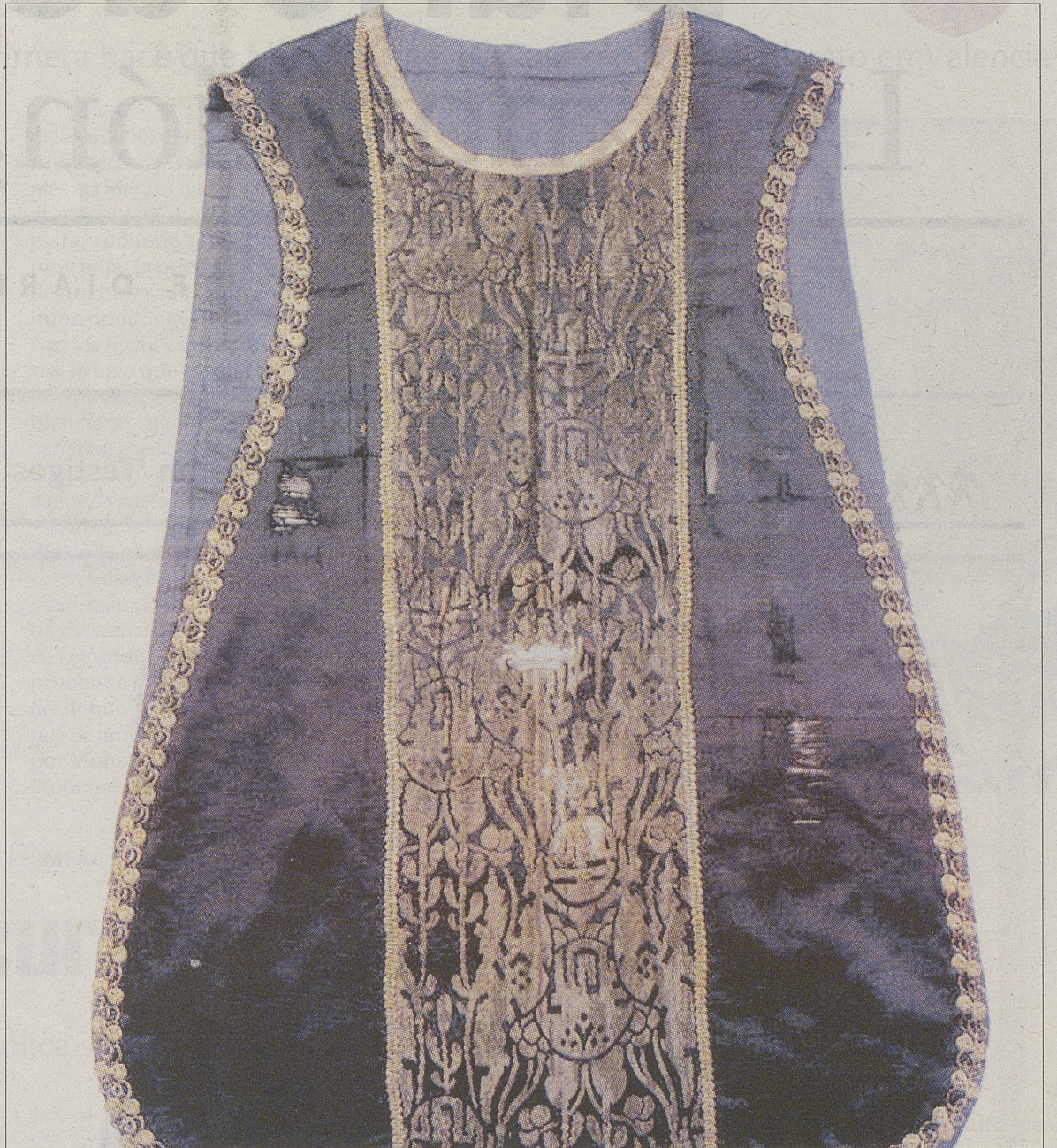
Parte delantera de la casulla de seda negra procedente de la localidad morañega de Pedro Rodríguez.

La casulla de Pedro Rodríguez presenta importantes deterioros en su parte delantera, lo que sin duda indica el mucho uso que se le dio durante un siglo de existencia, aunque tratándose de la sociedad rural del siglo XIX en España, nada tiene de extraño.