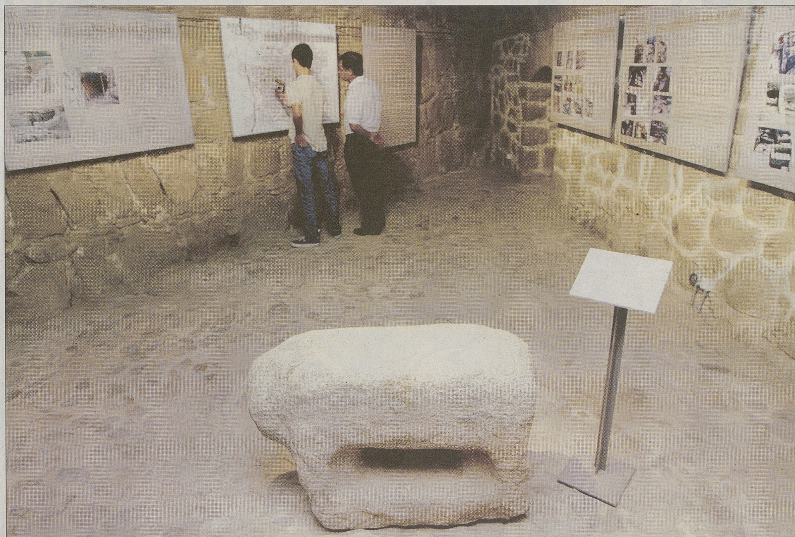
Un llamativo berraco preside una de las zonas de la exposición que albergan las Bóvedas del Carmen.