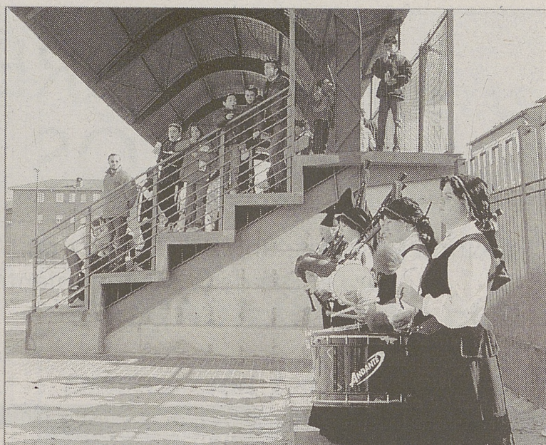
El grupo de gaiteros, en el campo de fútbol.

► Horario exposición. La muestra organizada por el Ayuntamiento 'Panorama Pictórico del siglo XX y XXI. Ayer, hoy y mañana' instalada en la iglesia de San Miguel puede visitarse en horario de 12:00 a 14:30 horas y de 16:30 a 21:30 horas.