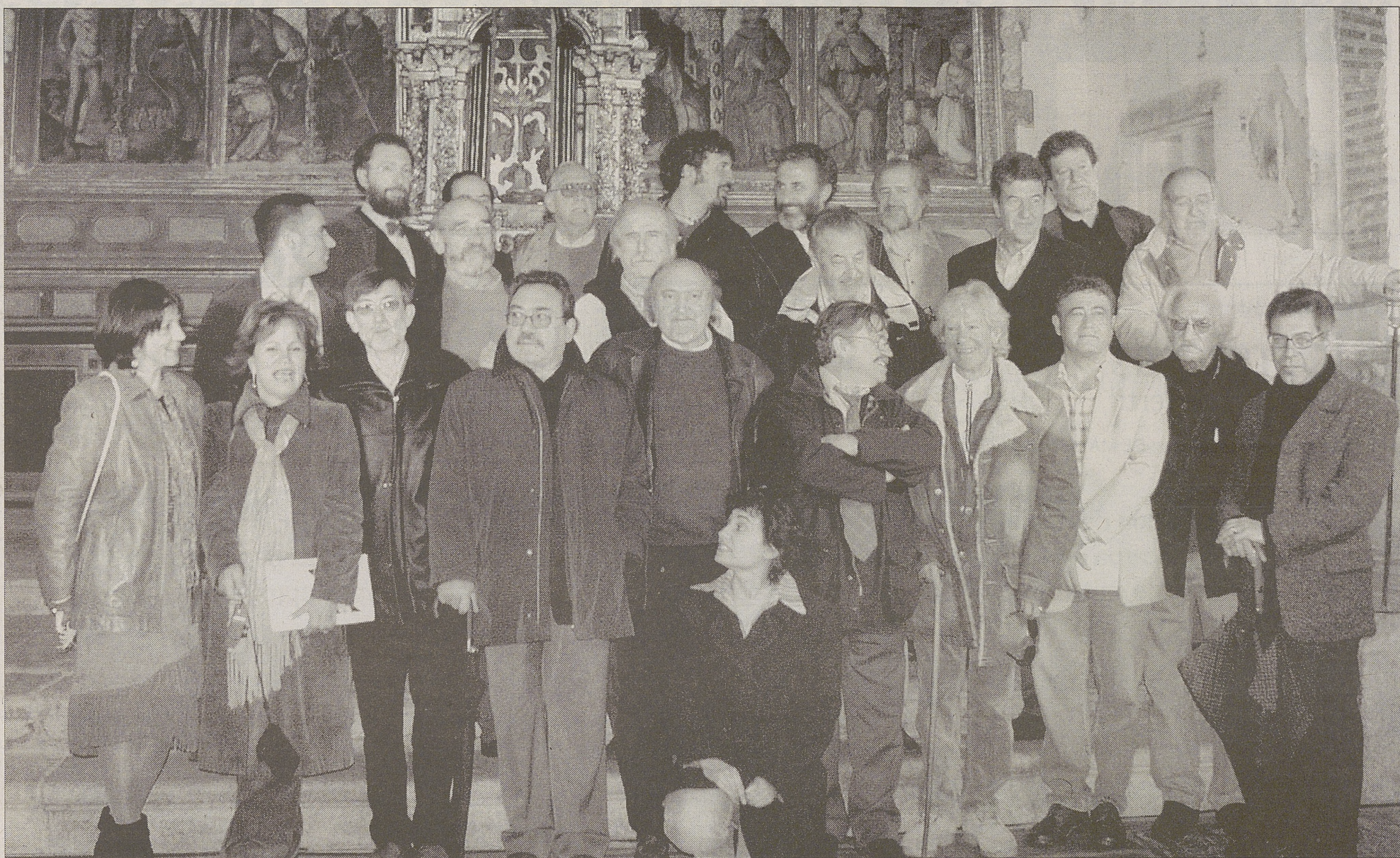
Los artistas que participan en la exposición 'Panorama Pictórico del siglo XX y XXI' posaron frente al retablo de la Iglesia de San Miguel.