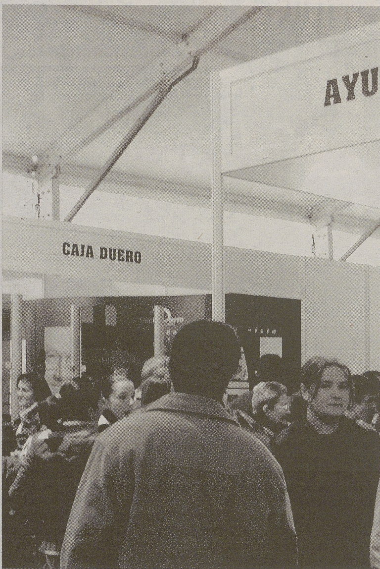
Público en la carpa de la Feria de Muestras.

Atractivos no faltan en esta edición de la Feria de Antigüedades y Muestras de Arévalo ya que se han instalado además a la entrada de la carpa las populares atracciones infantiles que hacen las delicias de los más pequeños y contribuyen a dar un toque festivo al recinto ferial ubicado en el parque Vellando.