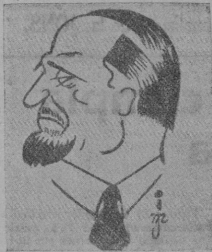
Roma. — Toda la prensa ensalza el discurso pronunciado en Londres por el embajador de Italia en dicha capital, Conde Ciano. El embajador declaró que existe en Europa y por parte de ciertas naciones un ambiente de injusticia nuevos errores y nuevas violencias. Asistimos actualmente a un recrudescimiento de mentiras y calumnias contra Alemania e Italia que demuestran la impotencia de nuestros adversarios.

Se comenta este discurso en el sentido que es la primera vez que un diplomático italiano, en paz extranjero, haya levantado su voz con tanta energía y firmeza para protestar de las calumnias lanzadas por ciertos medios.