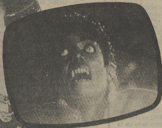
Casi doscientos millones de pesetas costó el video de «Thriller», dirigido por John Landis y en el que MICHAEL JACKSON aparece de «hombre-lobo». Una inversión rentable: veinte millones de LP vendidos

CUANDO todavía falta más de un mes para que sean entregados los premios Grammy, el equivalente a los Oscar cinematográficos, los miembros de la Academia Nacional de las Ciencias de la Música Americana ya han dado a conocer la lista de los nominados a tan preciado galardón.