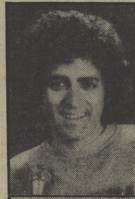
PALABRA DE MARISCAL