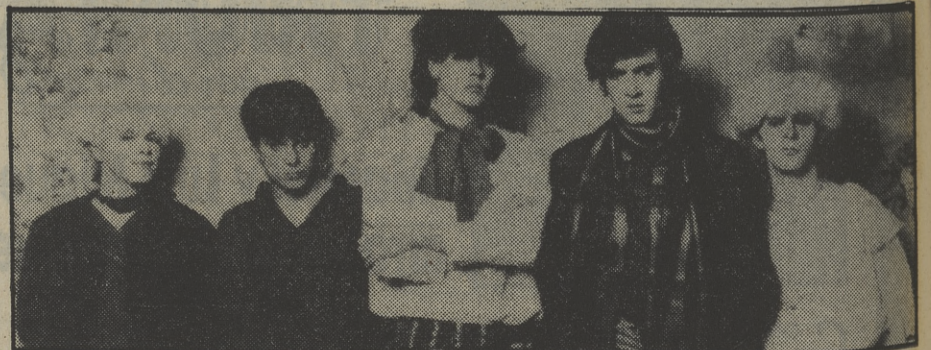
DURAN DURAN, considerados ya como los Beatles de los ochenta

Así está el panorama musical claramente definido por la Prensa anglosajona, que delimita claramente los términos pop y rock, que aquí en España, con tanta facilidad, tratan de fundir algunos críticos bastante despistados. El pop de los ochenta va ya configurando quiénes serán sus nuevas figuras para el gusto, sobre todo, de un público netamente consumista y seguidor de las poses y modas más que del propio mensaje cultural de la música. Por su parte el rock vive su mejor momento por los caminos de las nuevas y brillantes bandas tipo DEF LEPPARD, IRON MAIDEN, QUIET RIOT, TWISTE SISTER, ROCK GODDES, MOTLEY CRUE, millonarias en ventas que conviven en las listas con los nombres sagrados del movimiento en los últimos quince años, como AC/DC, RAINBOW, BLACK SABBATH, ZZ TOP, KANSAS, ALICE COOPER y un larguísimo etcétera que hoy, como antaño, sigue invadiendo las listas de éxito de todo el mundo con un lenguaje musical pionero de una gran movida ideológica, donde se sigue tributando culto a la imaginación y al virtuosismo más que al «look» y la estética sofisticada de los que se han venido a llamar nuevos reyes del pop.