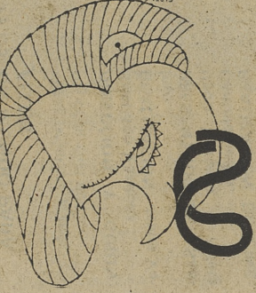
Una caricatura de Iñigo

21.30 ESTUDIO ABIERTO DIRECCION Y PRESENTACION: José M. Iñigo Navarrete.