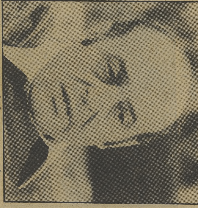
Jesús Puente, el «Juan» de «Las tormentas no vuelven»