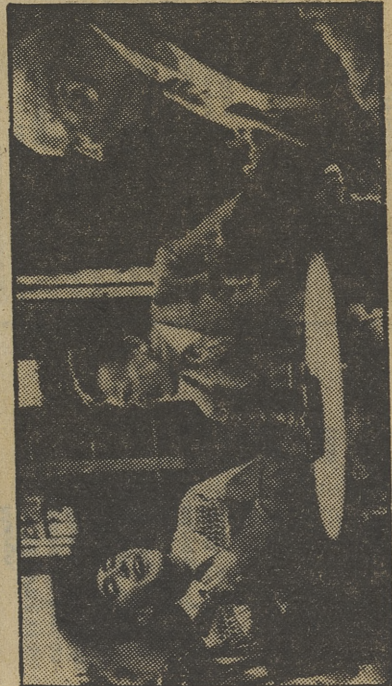
El que mejor vive en «Thomas y Sarah» es el marido