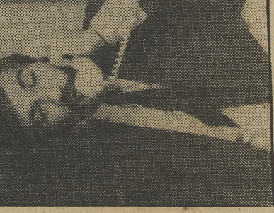
Arozamiento, hoy en la 2