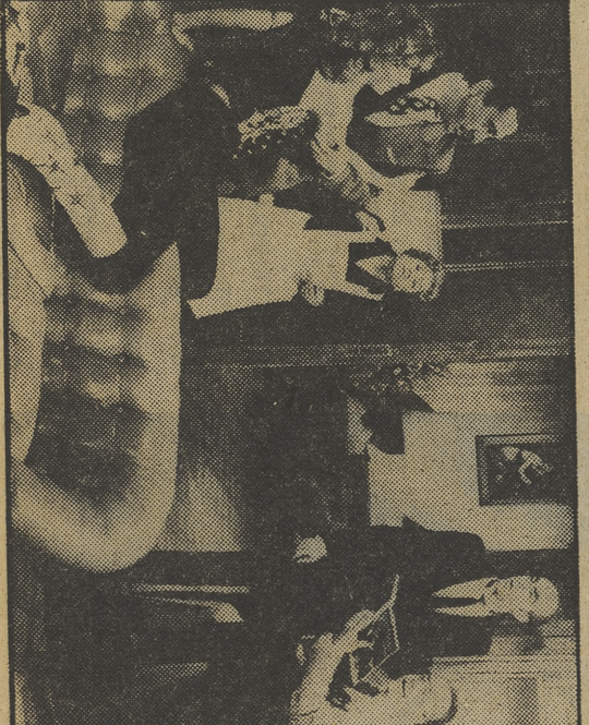
Todos los de «Lecturas de tocador», en plena sesión amorosa

23.40 LA EDAD DE ORO 0.55 DESPEDIDA Y CIERRE