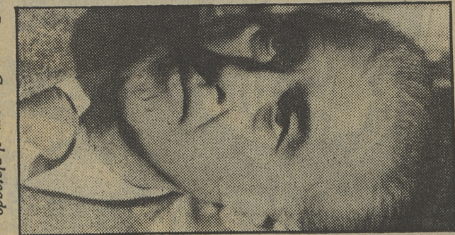
Stewart Granger, el plateado prisionero de Zenda («Sábado cine»)