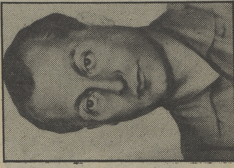
El fundador de la Falange, en «Memoria de España»

«Sesión de noche» contará con la presencia de Alec Guinness