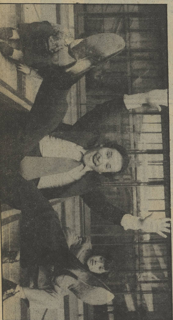
El «pequeño gran hombre» de la tarde de los Jueves