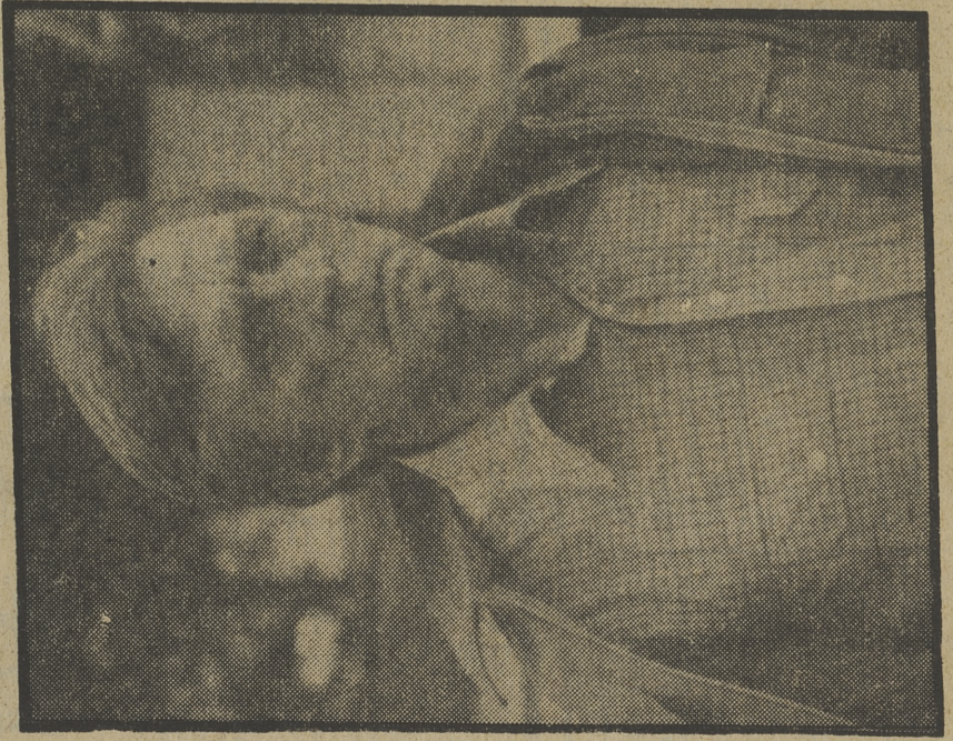
Kirk Douglas, en «Cautivos del mal»