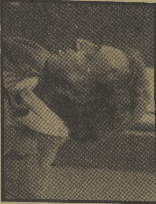
Héctor Alterio, en «Teatro»