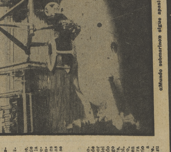
«Mundo submarino» sigue apasionando

22,00 SU TURNO DIRECCION: GUION Y PRESENTACION: Jesús Hermida. REALIZACION: Alvaro de Aguiñaga. Programa de debate. 23,00 ESTUDIO ESTADIO 24,00 DESPEDIDA Y CIERRE