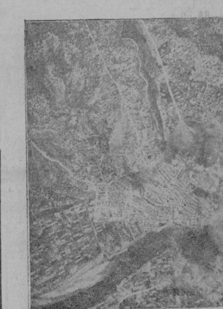
Publicamos una maravillosa fotografía, que muestra la precisión matemática de nuestros aviadores. Es un bombardeo de uno de los puertos que aprovecharon los catalanes, que aprovecharon los catalanes, para ir a buscar la tumba al otro lado. El puente cogido por la bomba es destruido, cogiendo en esta forma la retirada a los

El reloj nos marcó el retorno. Otra vez camino de lo difícil. Nos despedimos de la ciudad, también cantando. Nos esperan otros compañeros para que los cantemos. Esta noche va a ser de orgía. Cada uno comentará a sus anchas. Habrá quien más egoísta, hará un examen inventivo de sus sensaciones y no querrá echarse a volar. Pensará en su novia, en su madre, en todas esas cosas que están unidas por semejanzas con el mundo que queda de gustar. Refunfuñando metrá la cabeza bajo la manta y dirá: "Pejrazos, caeros ya y apagar la vela que los mosquitos me asan". No faltará quien susurre: "El que no sepa distinguir que se muera. Aire". Y hará una especie de signo cabalístico con la mano.