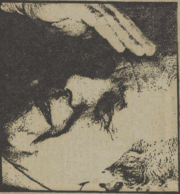
LUIS G. BERLANGA dirigió "Novio a la vista" hace veintinueve años