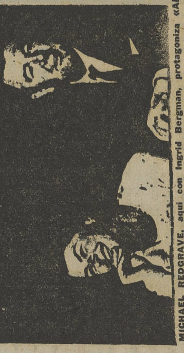
MICHAEL REDGRAVE, aquí con Ingrid Bergman, protagoniza «Al morir la noche»