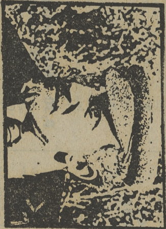
RON MOODY, protagonista en "El minotauro"