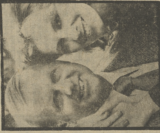
«CON OCHO BASTA»