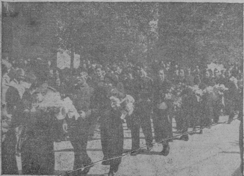
La comitiva de novios dirigiéndose, entre el calor de los fervientes M.C.D. 2022, plausos del público, a la Catedral.

Al llegar ante el altar, los novios van tomando sitio en los lugares prefijados. En ambos lados se ha-