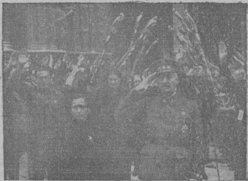
Nuestra primera autoridad Militar, el General Excmo. Señor Don Trinidad Benjumeda del Rey, con la madrina de las bombas, nuestra camarada Catalina Sureda de Dezcallar saliendo de la Basílica después de celebrada la Misa.

El "España" chocó contra una mina a la deriva.—La formidable actividad de nuestra escuadra.