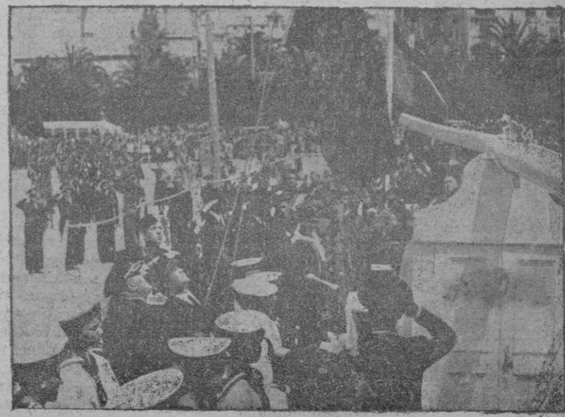
olemnem momento. El Contraalmirante Bastarreche eleva el gallardo de Falange en el palo mayor del «Unión».

Pero quizá sean los aviones «fascistas» los que han destrozado tales obras, pérdida irreparable para España y la humanidad culta.