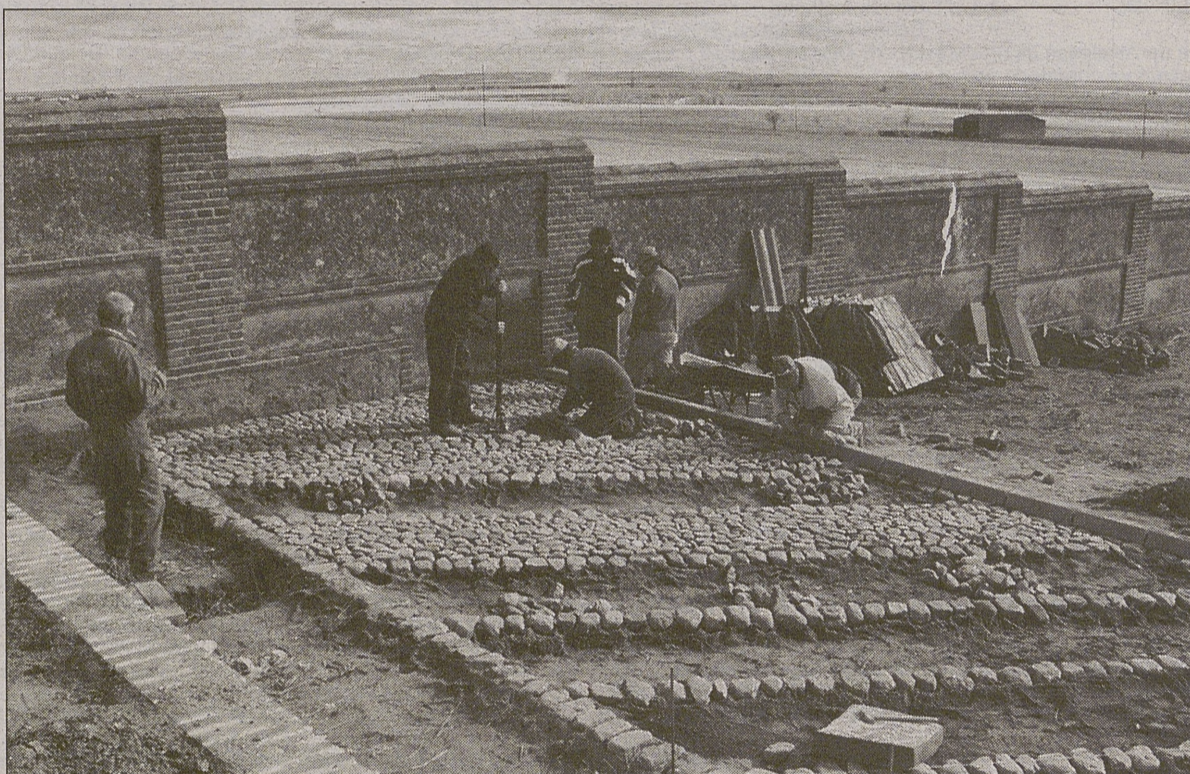
Trabajadores del Plan de Empleo Rural en la localidad de Madrigal de las Altas Torres

Las subvenciones se conceden directamente a los municipios con el fin de que contraten a trabajadores desempleados para la realización de obras y servicios de interés general. Los sueldos que cobran los beneficiarios de este plan de empleo se corresponden con los del convenio colectivo del sector en el que se incluyen las obras, correspondiendo a cada uno