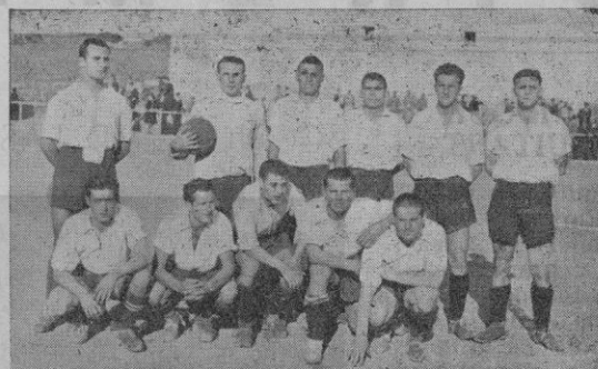
El C. D. Mercadal

Partido grande el que veremos mañana en San Nicolás. El Ciudadela recibe la visita del C. D. Mercadal, el equipo destacado en el primer puesto de la clasificación y que el pasado domingo venció en su terreno de San Martín a la Unión Deportiva.