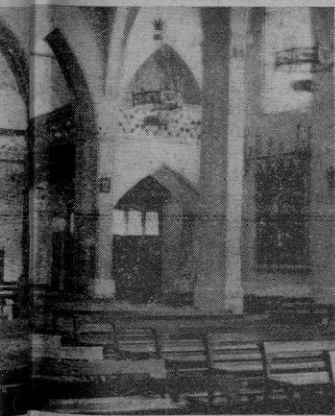
Se aprecia la sencilla esbeltez del Santuario de María Auxiliadora.