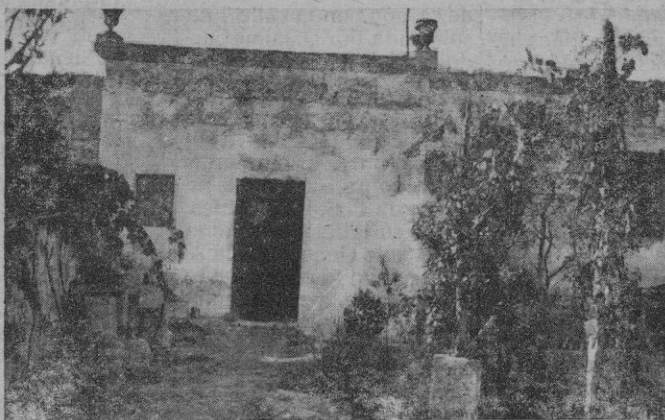
La casita del huerto donde residió el primer Oratorio, cuna del actual Colegio Salesiano.

Cuando el 8 de Diciembre de 1877, el joven Seminarista de 24 años dirige su escolania que canta el Te-Deum después de la misa celebrada como función inaugural de su escolania, experimenta la satisfacción de ver acrisolada la idea que le dominara en las horas de recreo, bajo la sombra de los narajos monacales.