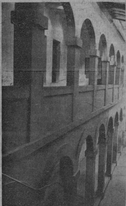
Detalle de las arcadas que dan acceso a las modernas clases del Colegio Salesiano.

con motivo del cincuentenario del primer templo español dedicado a María Auxiliadora