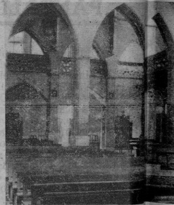
Tra las arcadas del nuevo templo español de María Auxiliadora.