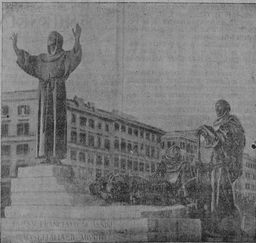
Monumento erigido a San Francisco de Asís en la Plaza de San Juan, de Roma, con motivo del VII centenario de su gloriosa muerte